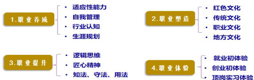
课程体系内容（4个模块14个项目）

1. 本课程的4个模块中，均设置了多项供学生选择学习的项目和任务，如：职业生塑造内容，学生按照自己的兴趣和能力选择四种文化中的1-2种进行学习和考核，既构建了完善的课程体系，也满足学生的个性化发展。